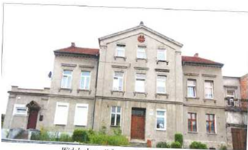
Widok elewacji frontowej-- ul. Górna 2.

na sprzedaż lokalu mieszkalnego Nr 2, znajdującego się w budynku położonym w Lubaniu przy ul. Górnej 2 wraz z udziałem we współwłasności nieruchomości gruntowej (działka nr 61, AM 6, Obręb V o powierzchni 248 m 2 , JG1L/00016048/3)