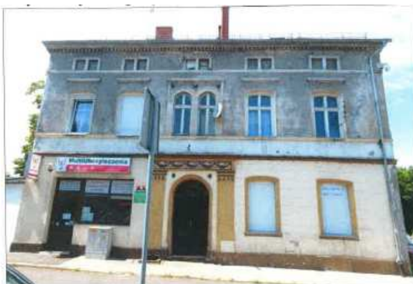
Widok elewacji frontowej – Plac Strażacki nr 5.

na sprzedaż lokalu mieszkalnego Nr 1, znajdującego się w budynku położonym w Lubaniu przy Placu Strażackim 5 wraz z udziałem we współwłasności nieruchomości gruntowej (działka nr 5, AM 4, Obręb III o powierzchni 164 m 2 , JG1L/00020876/7)